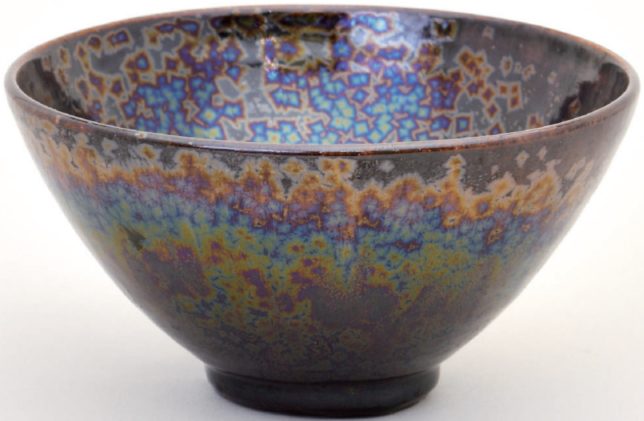
エメラルド釉窯変結晶茶盃