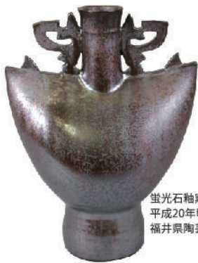
蛍光石釉窯変結晶耳付扁壺 平成20年頃 福井県陶芸館