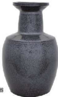
油滴天目釉花瓶 昭和44年3月 昭和44年昭和宮殿納入姉妹品