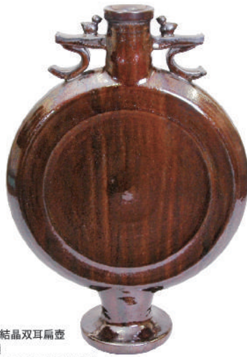
鉱物釉窯変結晶双耳扁壺 平成14年頃 傘寿 木村盛和展(高島屋)出品作