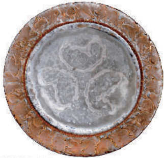
鉄銅釉窯変大皿 平成7年 郷土の作家たち展(福井県立美術館)出品作 福井県陶芸館